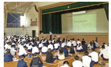
進路講演会の様子

予備校講師から、大学受験の現状・入試情報を講演してもらい、進路意識を高めています。