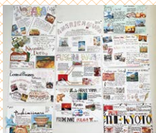
英語のポスターを作成する機会があります!